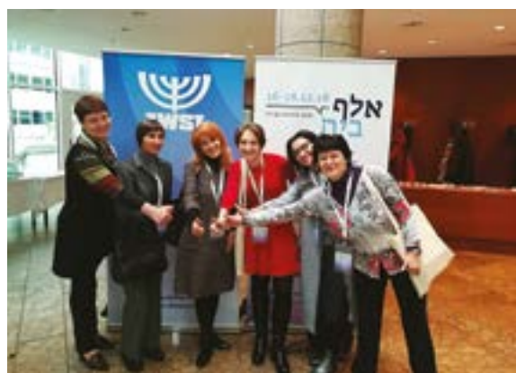
Франкфурт. Конференция «Алеф-Бэт». Спектакль по Я. Корчаку