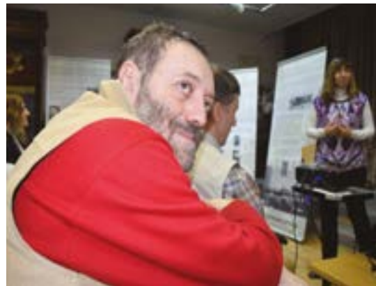
Открытие выставки состоялось в Киевском Музее Шолом-Алейхема